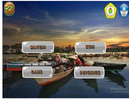
Gambar 2. Halaman Utama