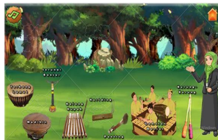
Gambar 4. Halaman Menu Materi

Halaman menu materi berisikan tombol menu musik tradisional pada gambar alat musik tradisional Kalimantan selatan, tombol menu home untuk kembali ke menu pemilihan judul, serta tombol sound on/off musik.