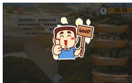
Gambar 7. Halaman Benar

Adalah halaman dimana pengguna dapat mengetahui sebuah jawaban itu benar yang disediakan pada media pembelajaran setelah hasil keluar maka halaman akan berubah ke halaman kuis selanjutnya.