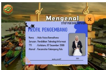
Gambar 11. Halaman Profil