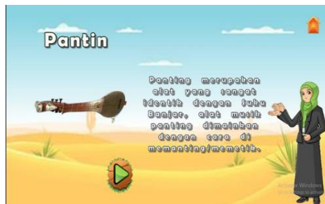
Gambar 5. Halaman Materi