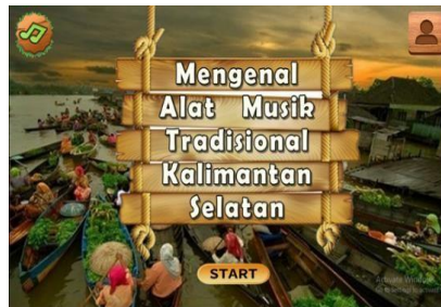
Gambar 1. Halaman Opening

Halaman opening pada media belajar ini berisikan tombol start untuk memulai, tombol menu profil, dan tombol sound musik.