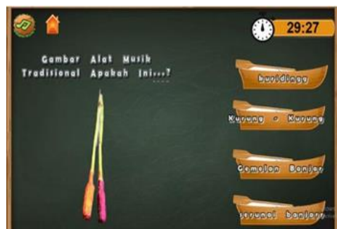
Gambar 6. Halaman Kuis

Halaman Kuis berisikan halaman dimana pengguna mengerjakan kuis yang disediakan pada media pembelajaran, terdapat tombol home untuk kembali ke halaman pemilihan menu, tombol sound on/off musik, serta tombol timer .