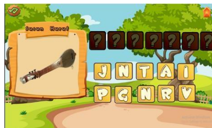
Gambar 10. Halaman Game

Halaman Game Susun Huruf adalah halaman dimana pengguna mengerjakan game susun huruf yang dimana game tersebut dimainkan dengan cara di tarik hurufnya ke bagian kotak berwarna hitam yang disediakan pada media pembelajaran, berisikan tombol home untuk kembali ke halaman menu pilihan, serta tombol sound on/off musik.