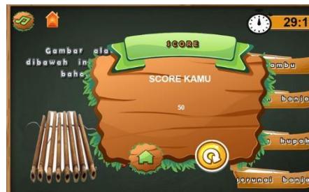
Gambar 9. Halaman Skor Kuis

Halaman skor kuis adalah halaman yang menunjukkan nilai dari sesi kuis yang sudah dilewati pengguna dalam mengerjakan kuis, berisikan tombol home untuk kembali ke halaman menu pilih, serta tombol kembali untuk mengulang kuis.