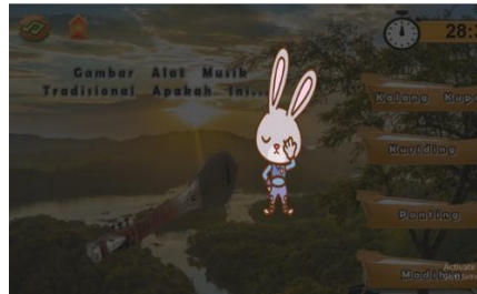
Gambar 8. Halaman Salah