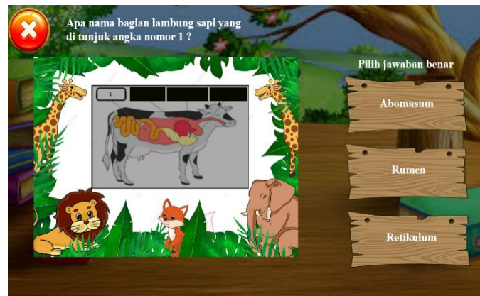
Gambar 5. Tampilan Halaman Latihan Media

Dalam penelitian ini, proses validasi media pembelajaran dinilai oleh 2 ahli bidang media dan 2 ahli bidang materi, masing-masing mereka berkompeten dan mengerti tentang media pembelajaran yang terkait dalam hal media dan materi. Pada penelitian ini, untuk mengetahui nilai kelayakan produk dari ahli media, ahli materi, uji coba perorangan, dan uji coba lapangan. Jika hasil akhir secara keseluruhan dengan minimal “Baik”, maka produk hasil pengembangan tersebut sudah layak digunakan sebagai media pembelajaran. Ditinjau dari 5 penilaian tersebut di peroleh hasil penilaian kelayakan media pada Tabel 2. Berikut ini.