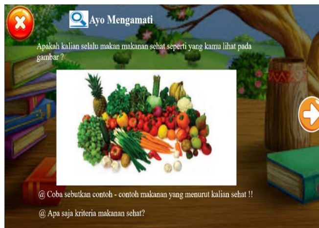
Gambar 4. Tampilan Halaman Materi Media