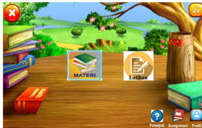
Gambar 3. Tampilan Halaman Menu Media