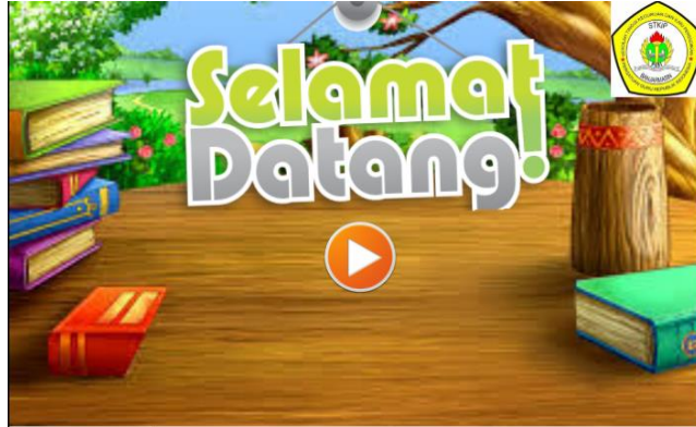
Gambar 2. Tampilan Awal Media

Tampilan dari media pembelajaran yang dikembangkan dalam penelitian ini dapat dilihat pada gambar berikut.